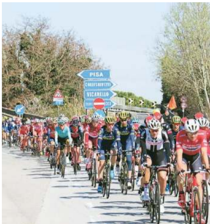
I ciclisti a Stagno in un'edizione della Tirreno-Adriatico

La viabilità subirà modifiche importanti. Il provvedimento straordinario per la viabilità che sarà emesso dal prefetto di Livorno istituirà la sospensione totale