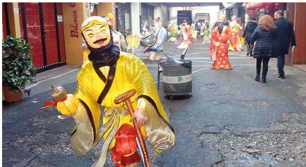
Le effigi degli "Otto saggi" nella galleria tra via Pistoiese e via Filzi

La ricognizione del quartiere insieme all'antropologa Sclavi: ecco i punti critici Oggi e domani il clou con la pulizia delle strade, la cerimonia del thé e le lanterne