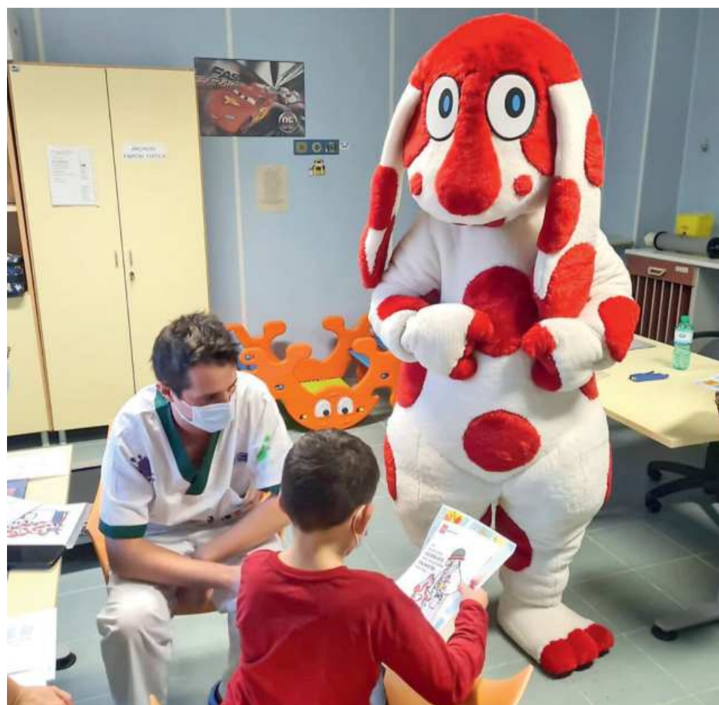
La Pimpa, "assistente" dello staff sanitario che vaccina i bambini

I bambini devono essere accompagnati da entrambi i genitori o da uno solo con la delega dell'altro. Il modulo per la delega può essere scaricato all'indirizzo www.uslsudest.toscana.it/cosa-fare-per/accedere-alla-vaccinazione-anti-covid-19 e va presentato, debitamente compilato e sottoscritto, alla sede vaccinale.