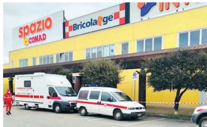
La postazione della Cri all'Aurelia Antica dove fare i tamponi rapidi

Sempre la Croce rossa di Grosseto apre i propri ambulatori via Mazzini, in centro storico, il martedì e il giovedì dalle 17 alle 20 e la domenica dalle 9 alle 12. Anche qui nella fascia dalle 17 alle 18 è