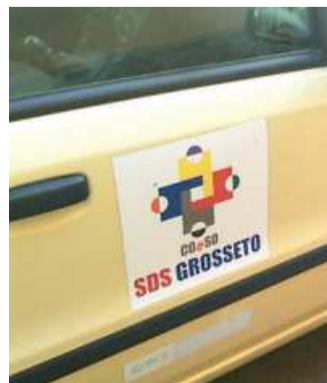
Un'auto del Coeso

Il progetto si intitola "Regoliamo insieme il gioco d'azzardo" e il suo obiettivo è quello di costruire un "modello" sovracomunale sul gioco lecito. Sono stati spediti gli inviti per partecipare all'incontro del 3 febbraio. Il fine sarà